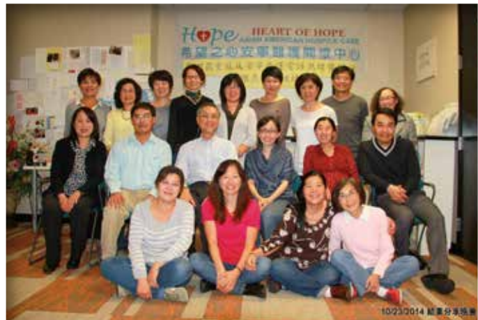
▲ 第四屆重症/安寧療護電話熱線暨家訪關懷義工訓練結訓