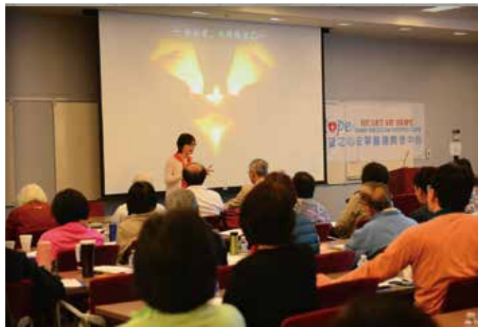
▲ 9/27/2014 重症病患家屬講習會