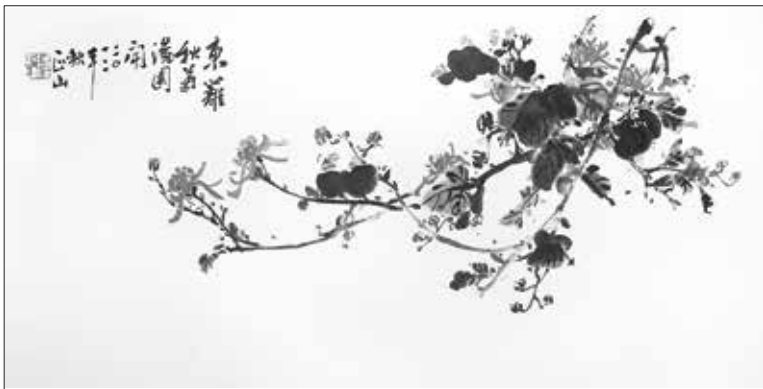
畫作尺寸：39"W x 19.5"H

馬來西亞現代藝術教育之父、享譽國際的著名書畫家鍾正山，全力支持「希望之心安寧醫護關懷中心」籌辦計畫。近期透過他旅居舊金山灣區的長子鍾泰元，捐贈一幅甚有收藏價值的「東籬秋菊滿園開」水墨畫給「希望之心安寧醫護關懷中心」義賣。「東籬秋菊滿園開」畫作尺寸：39"W x 19.5"H。鍾先生的作品在中國大陸每幅均以超過美金萬元以上出售。「角聲癌症關懷」從現在開始公開標售，有意購買者請聯繫龔振成主任(408) 986-8584。「東籬秋菊滿園開」將於十月十二日「生命禮讚」籌款音樂會時售予最高標價者。