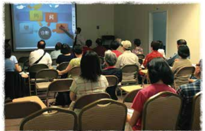
社區民眾踴躍參加「生命關懷」講座，學習醫療保健新知